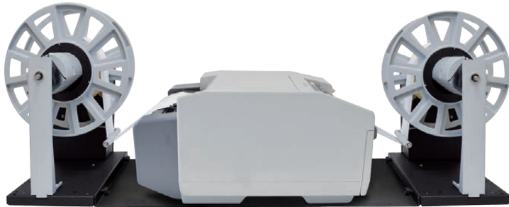
SVOLGITORE - EPSON C831 (stampante non inclusa) - AVVOLGITORE