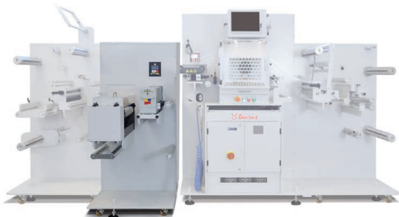
Modulo UV Varnish inline con Taurus

L'accessorio di verniciatura, di facile utilizzo, consente una protezione del media alternativa alla classica laminazione a freddo per offrire una finitura al livello superiore.