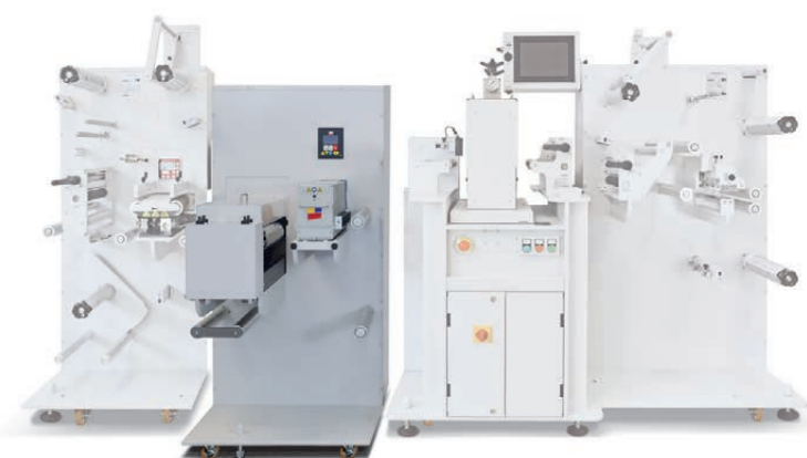
Modulo UV Varnish inline con Aries