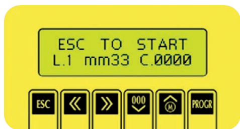
Pannello di controllo

* Software per etichette lunghe fino a 600mm disponibile su richiesta